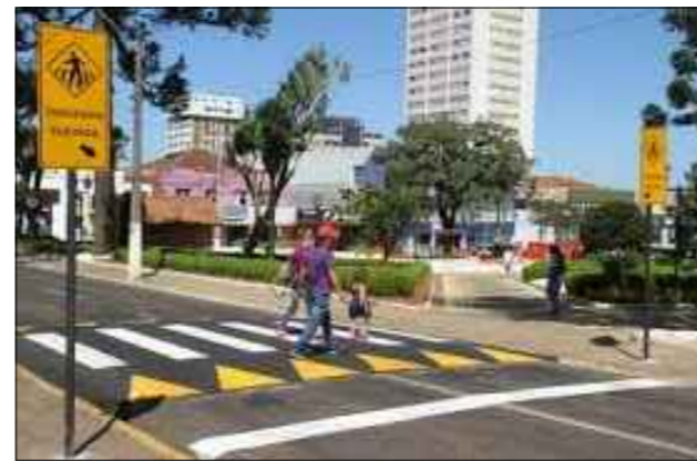
Exemplo Faixas de Travessia de Pedestres