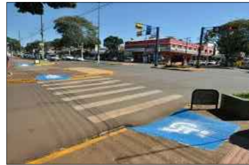
Exemplo Acesso A Cadeirante