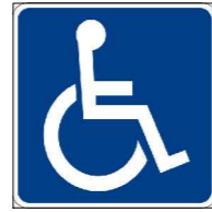
Detalhe de Acesso A Cadeirante