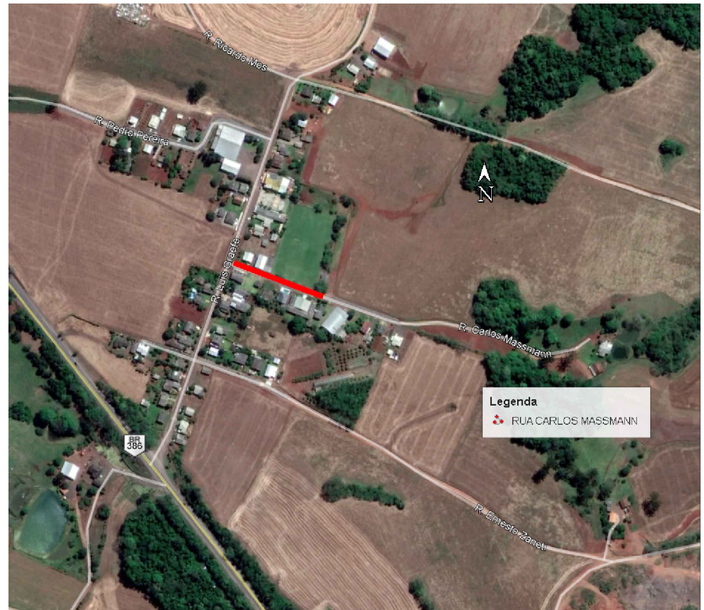
LOCALIZAÇÃO Imagem de satélite Sem escala